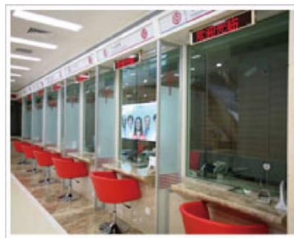
中国银行陕西省分行