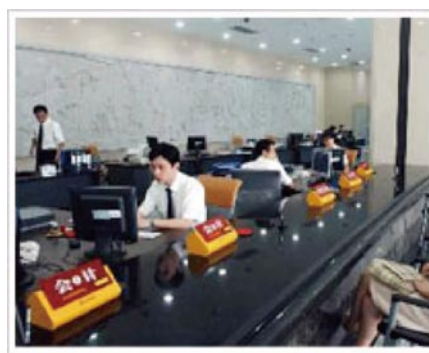
浙商银行营业大厅