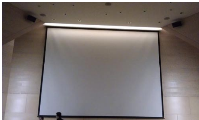
法国大使馆，整体占地近2万m 2 主要由中国工人建设