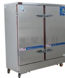
电气两用快速蒸饭车